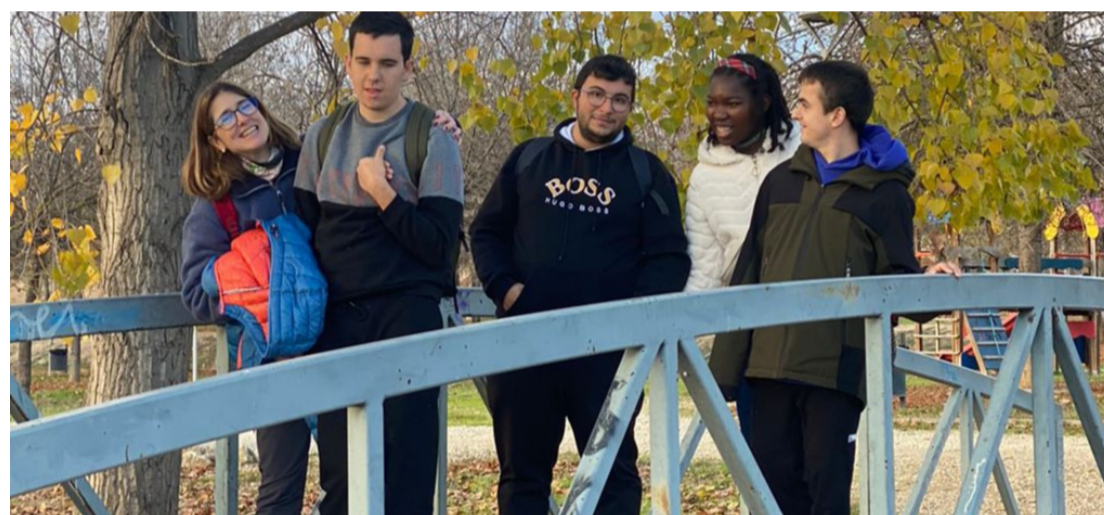
Voluntariado y uno de los grupos de ocio.

son un pilar fundamental en actividades como el proyecto de ocio.