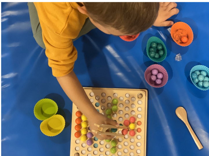
Uno de nuestros usuarios en sesión.